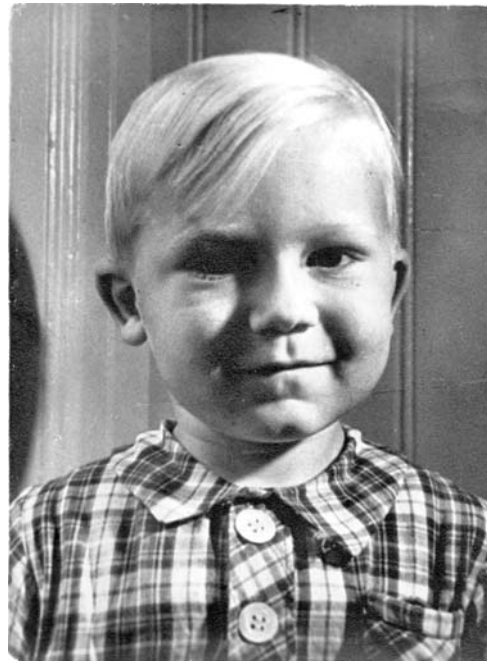
Billede af mig fra 1942.