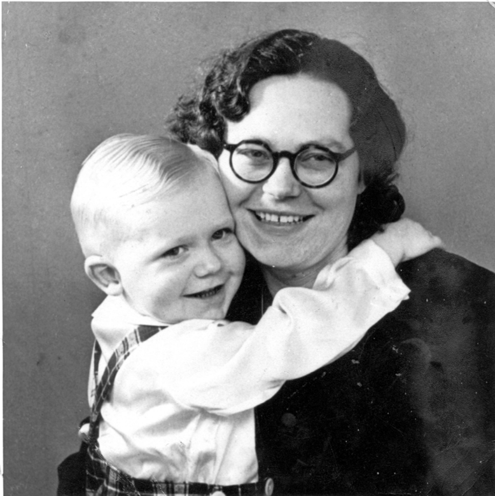
Mor og jeg (1941). Vi er allerede alene.